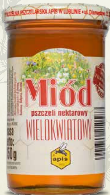
Miód wielokwiatowy 350 g