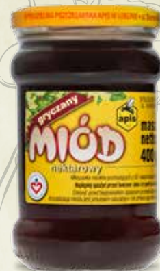
Miód gryczany 400 g