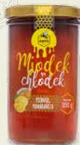
Miodek na chłodek o smaku Piernika i Pomarańczy 350 g