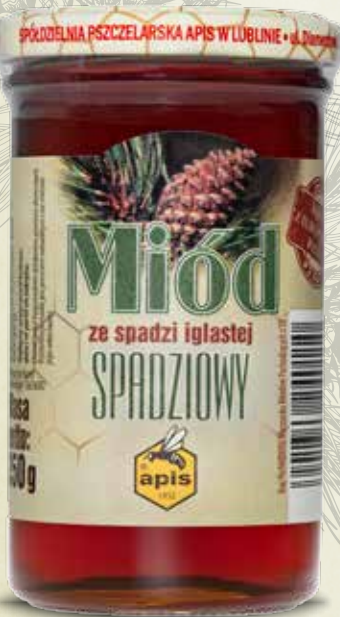
Miód spadziowy 350 g