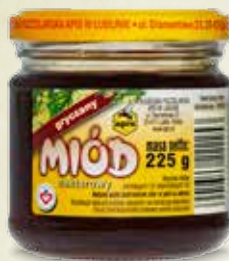
Miód gryczany 225 g

W kolorze brązu o ostrym smaku i aromacie. Zalecany przy niedoborze żelaza w organizmie, rekonwalescentom po zabiegach operacyjnych. Z uwagi na dużą zawartość rutyny przypisuje się mu również właściwości odmładzające. Doskonali do wypieków i produkcji miódów pitnych.