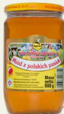
Miód wielokwiatowy z polskich pasiek 900 g