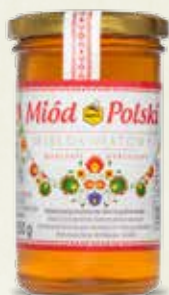
Miód Polski wielokwiatowy 350 g