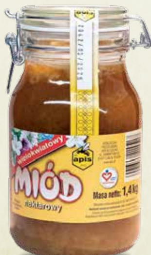
Miód wielokwiatowy kłama 1.4 kg