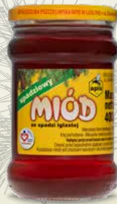
Miód spadziowy 400 g