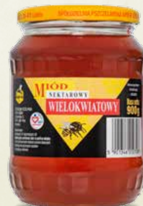
Miód wielokwiatowy 900 g