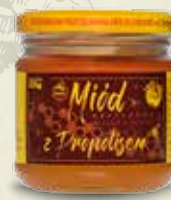
Miód z propolisem 225 g

MIODY WIELOKWIATOWE SMAKOWE KOMPOZYCJE MIODOWE