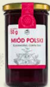
Miód Polski & Prawoślaz, Czarny bez 350 g