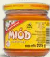
Miód wielokwiatowy 225G