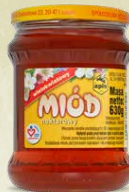
Miód wielokwiatowy 630 g