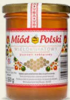
Miód Polski wielokwiatowy 550 g