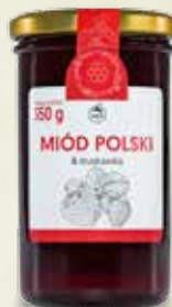
Miód Polski & Truskawka 350 g