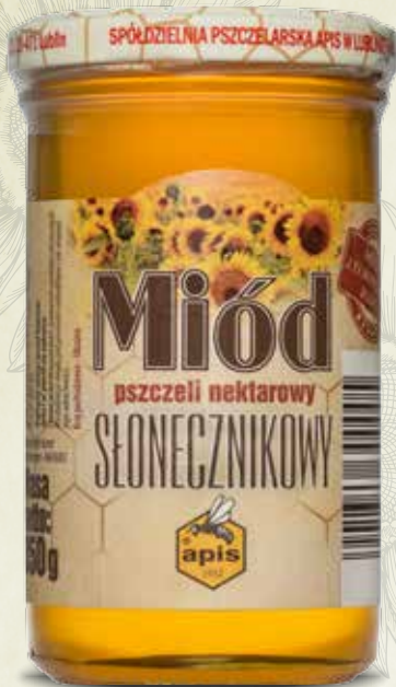
Miód słonecznikowy 350 g