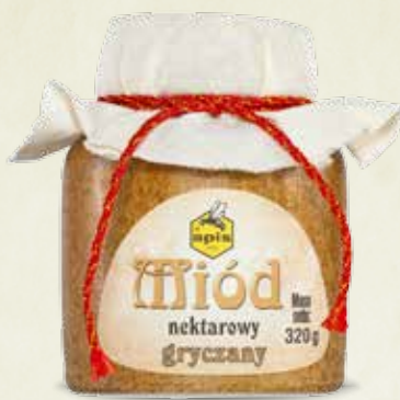
Miód gryczany kamionka 320 g