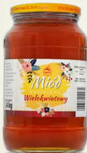
Miód wielokwiatowy 1.4 kg