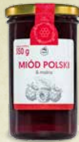
Miód Polski & Malina 350 g