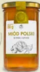
Miód Polski & Imbir, Cytryna 350 g