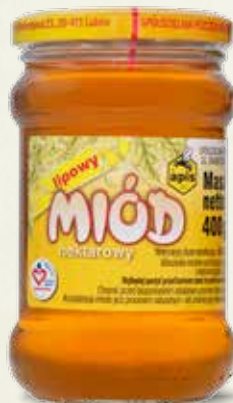
Miód lipowy 400 g

Charakteryzuje się silnym aromatem kwiatów lipy. Zalecany przy przeziębieniach, grypie, kaszlu, działa uspokajająco na system nerwowy.