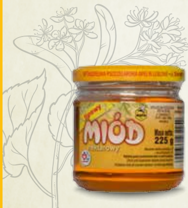
Miód lipowy 225 g