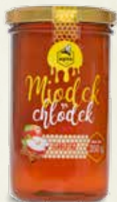
Miodek na chłodek o smaku Szarlotki 350 g