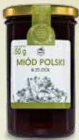
Miód Polski & 20 Ziół 350 g