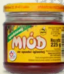
Miód spadziowy 225 g

Szczególnie bogaty w związki mineralne. Zawiera substancje lecznicze stosowane w schorzeniach dróg oddechowych. Miód ze spadzi iglastej posiada właściwości bakteriostatyczne.