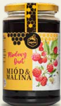
Miódowy duet Miód & Malina 500 g