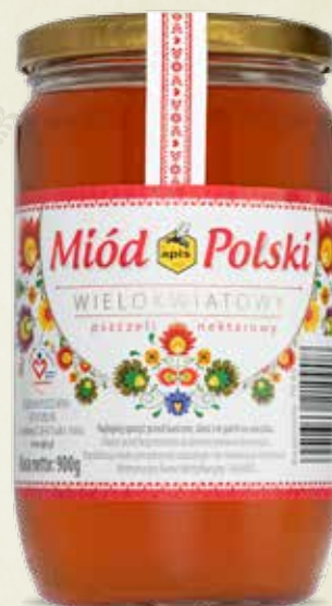
Miód Polski wielokwiatowy 900 g