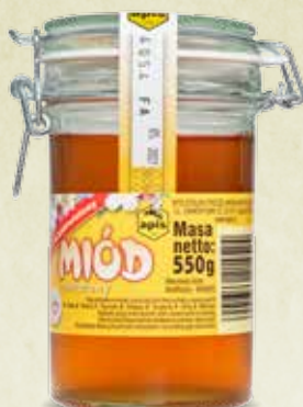
Miód wielokwiatowy klamra 550 g