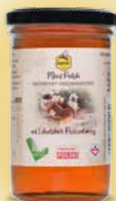
Miód Polski wielokwiatowy od Lubelskich Pszczelarzy 350 g