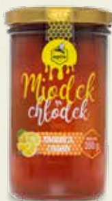
Miodek na chłodek o smaku Pomarańczy i Cynamou 350 g