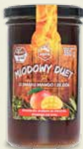
Miódowy duet o smaku Mango i 20 Ziół 350 g