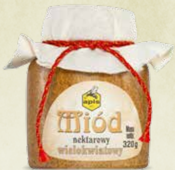
Miód wielokwiatowy kamionka 320 g